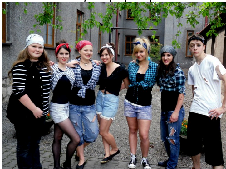
Część klasy 9. jako piraci na festynie szkolnym.

Czy nowy przedmiot wybór zawodu pomógł ci przy wyborze nowej szkoły?