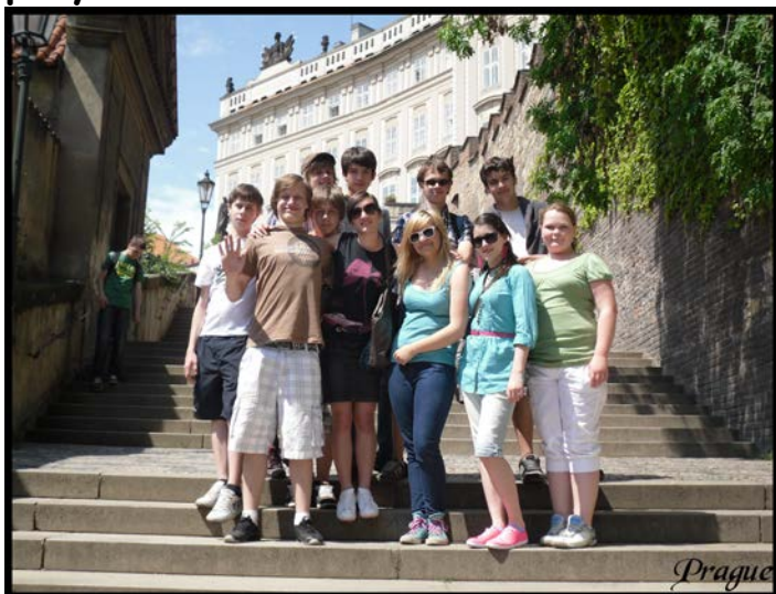
Część klasy 9. na wycieczce w Pradze